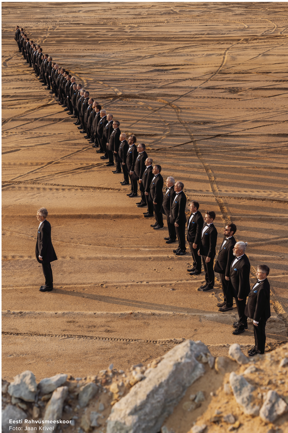
Eesti Rahvusmeeskoor