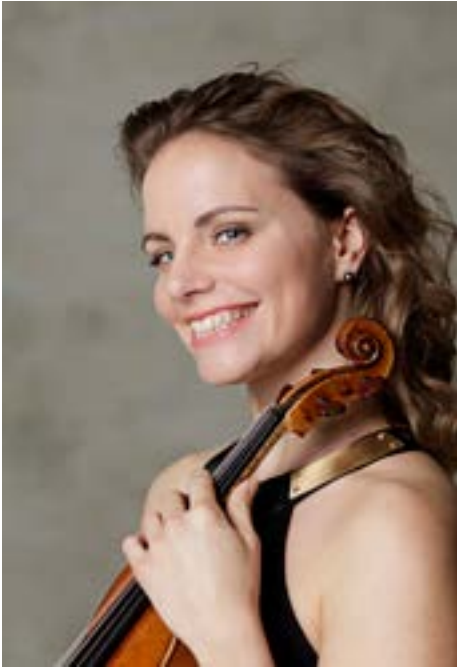
Julia Fischer.