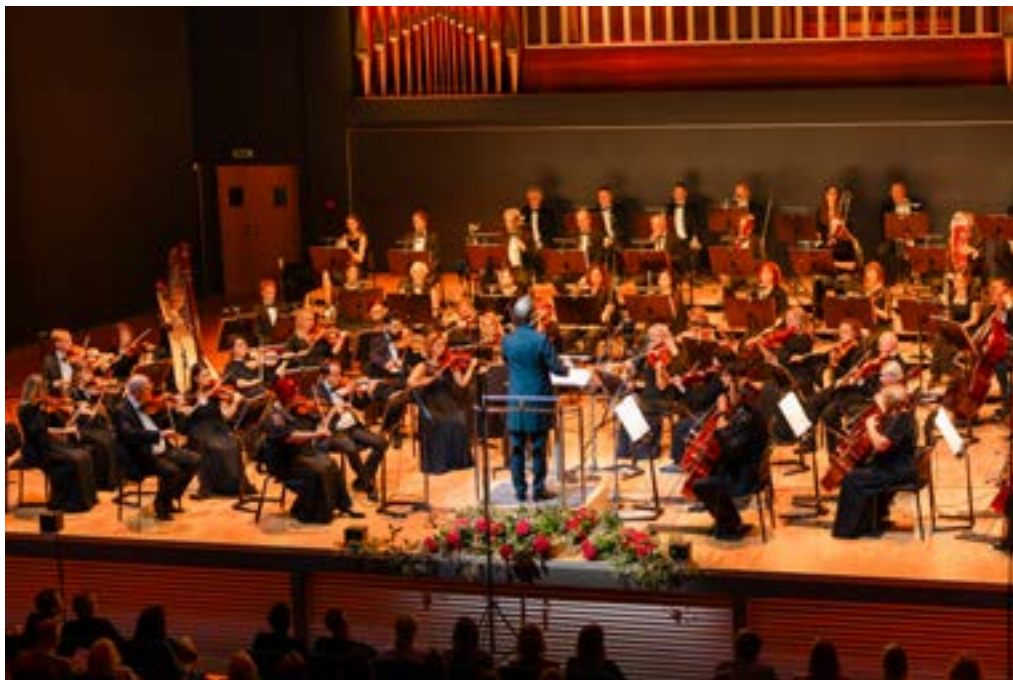
Vanemuise sümfooniaorkester.