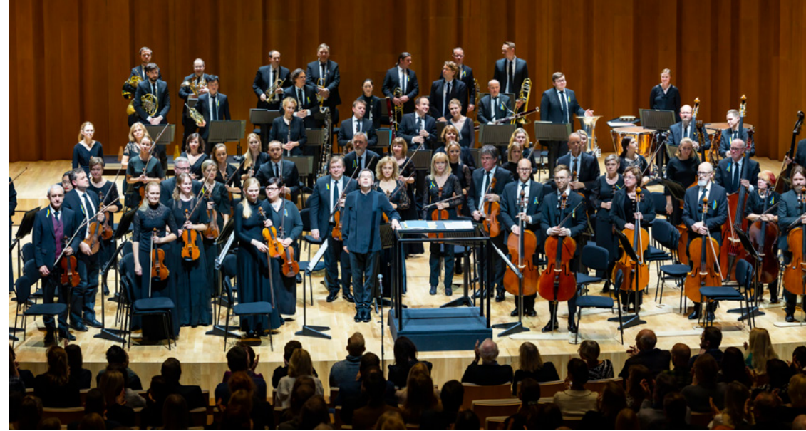
Eesti Riiklik Sümfooniaorkester