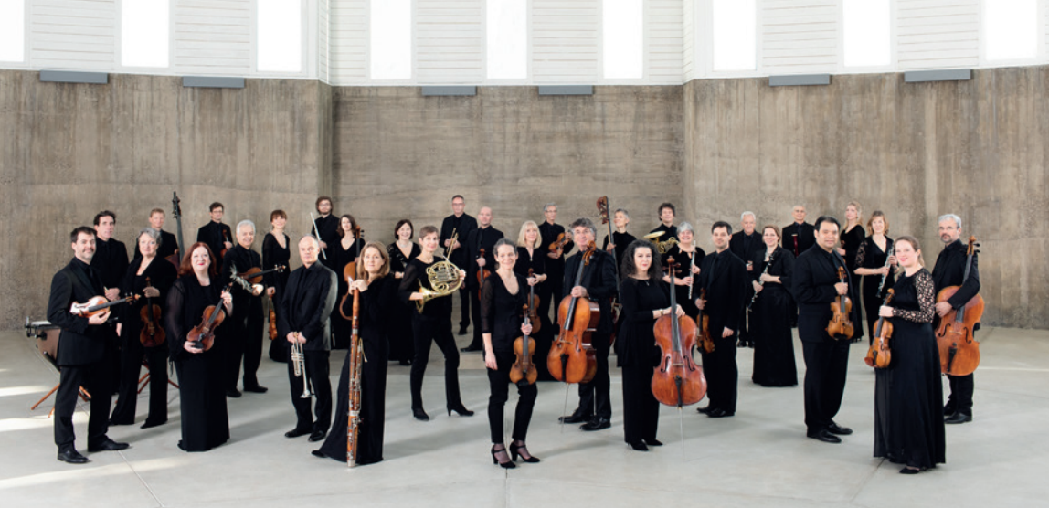
Academy of St Martin in the Fields

Academy of St Martin in the Fields (ASMF) on üks maailma paremaid ja erilisemaid kammerorkestreid, mis on tuntud oma värskete ja säravate tõlgendustega orkestrimuusika kuldrepertuaarist. Orkestri pani 1958. aastal Londoni tippmuusikutest kokku Sir Neville Marriner ja see on oma nime saanud kiriku järgi, kus toimus 1959. aasta novembris nende esimene kontsert.