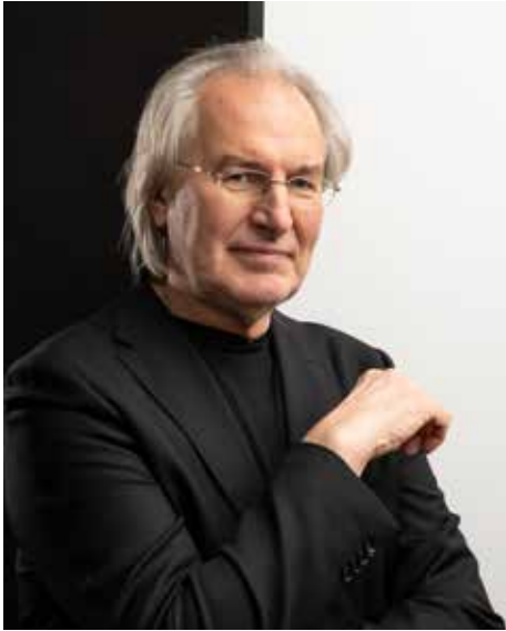
Tõnu Kaljuste.

Aastatel 2010–2020 oli Kaljuste Eesti Muusika- ja Teatriakadeemia professor ning dirigeerimisosakonna juhataja. Ta on Tallinna Kammerorkestri asutaja (1993) ning alates 2019. aasta sügisest taas TKO peadirigent ja kunstiline juht. Kaljuste on Eesti Filharmoonia Kammerkoori asutaja (1981) ning alates 2021. aasta augustist, pärast 20-aastast vahet, taas EFK peadirigent ja kunstiline juht. Alates 2004. aastast on Kaljuste tema enda asutatud projektiteatri Nargen Opera kunstiline juht. Tema eestvedamisel on 2006. aastast toimunud Nargenfestival.