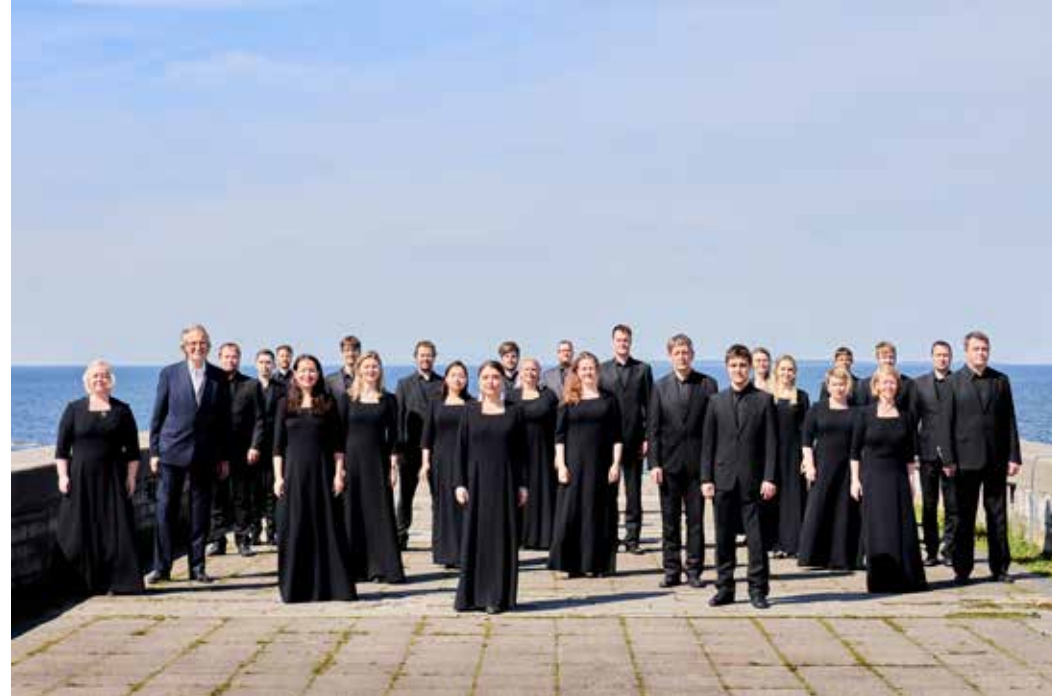
Eesti Filharmoonia Kammerkoor.