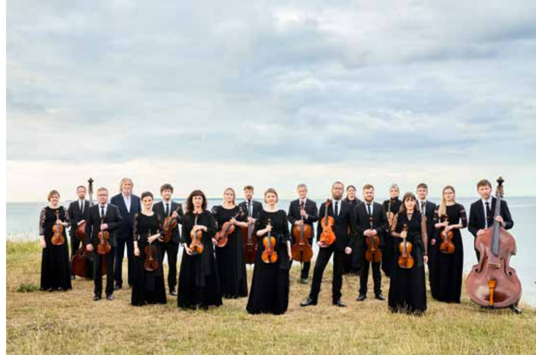
Tallinna Kammerorkester.