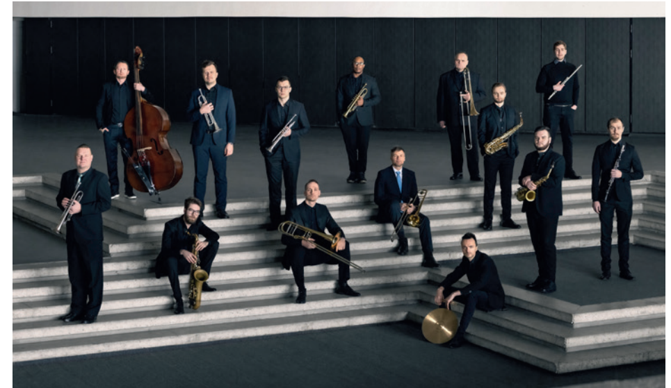
New Wind Jazz Orchestra

NWJO on oma kuue tegutsemisaasta jooksul jaganud lava nimekate artistidega üle maailma, näiteks Soome tuntuima bigbändijuhi ja trombonisti Antti Rissaneniga, Saksamaa juhtiva džässorkestreid dirigeeriva Wolf Kerschekiga ning maailmakuulsasse Ameerika bigbändi The Vanguard