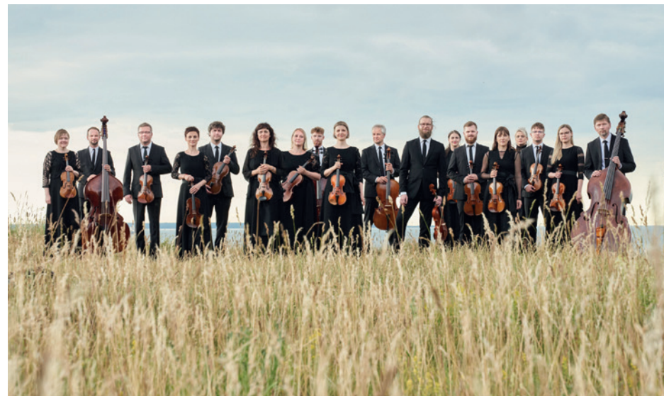
Tallinna Kammerorkester

Tallinna Kammerorkestri (TKO) asutas 1993. aastal dirigent Tõnu Kaljuste. Kolme aastakümne jooksul on orkestrist kujunenud üks Eesti esinduskollektiive, kes on oodatud esineja kontserdilavadel nii Euroopas kui ka mujal maailmas. TKO on ärganud tähelepanu oma kunstiliselt terviklike kavade, stiilitundliku musitseerimise ja kõrgetasemelise interpretatsioonikunstiga. Orkestri mitmekülgses repertuaaris on esindatud nii baroki-, klassitsismikui ka romantismiajastu muusika; oluliseks osaks on 20. ja 21. sajandi