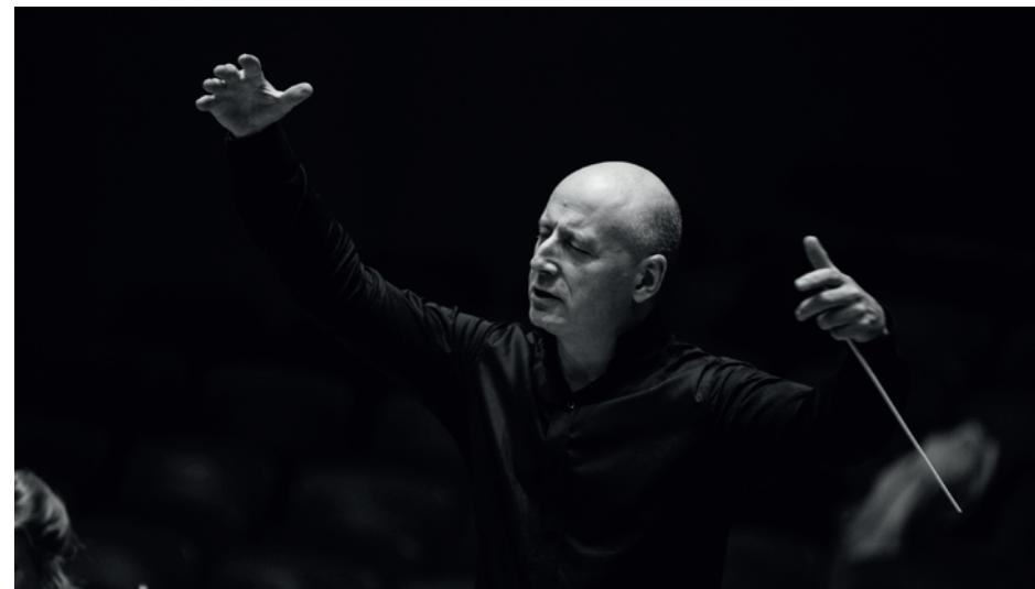
Paavo Järvi

2024. aastal tähistab Paavo Järvi oma 20. aastapäeva Bremeni Saksa Kammerfilharmoonikute kunstilise juhi ametis. Selle kollektiiviga on ta esitanud ja salvestanud etaloniks saanud ettekandeid Beethoveni, Schumanni ja Brahmsi orkestrimuusikast. Nende viimane projekt oli pühendatud Haydni „Londoni sümfooniatele“, mida esitati orkestri residentuuri ajal Viini Kontserdimajas ning detsembris toimunud turneel Kölnis, Hamburgis ja Dublinis. Sel aastal süvenetakse Schuberti sümfooniatesse.