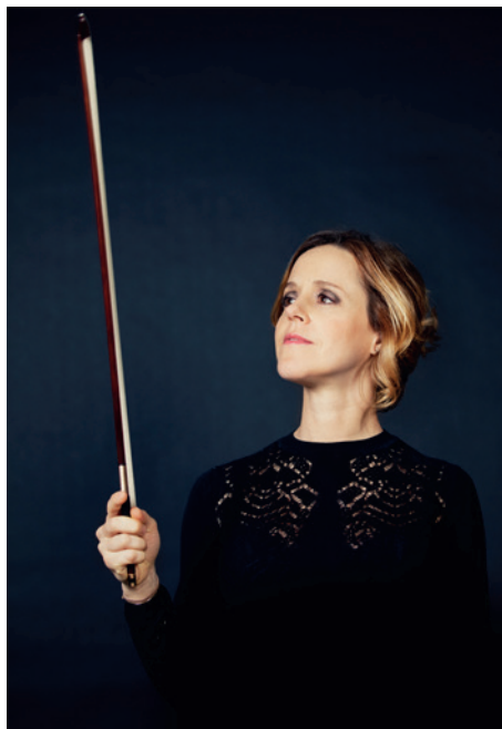
Sol Gabetta

Sol Gabetta on oodatud külalisesineja mainekatel festivalidel: ta on olnud Luzerni Festivali peaesineja, astudes üles Viini Filharmoonikute ja Franz Welsler-Mösti, Mahleri Kammerorkestri ja François-Xavier Rothi ning Londoni Filharmooniaorkestri ees Marin Alsopi juhatusel. Ta jätkab inspiratsiooni ammutamist muusikalistest kohtumistest Solsbergi Festivalil, mis toimub tema pühendunud kunstilise juhtimise all.