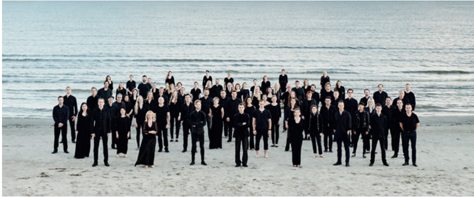
Eesti Festivaliorkester

Need arvustused kirjeldavad hästi Paavo Järvi soovi – tuua kokku muusikud ja sõbrad ühte orkestrisse, millest kujuneb kogu festivali hing. „Hingestatus on see, mis seda orkestrit edasi viib,“ ütleb Järvi, „ja igal suvel on suur rõõm näha, kuidas suhted arenevad ja meie endi ning maailma talendid on üha enam kokku kasvanud.“