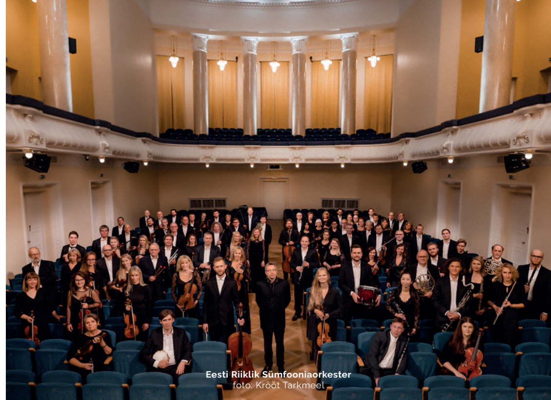
Eesti Riiklik Sümfooniaorkester

Carolina Eyck korraldab regulaarselt töötubasid, loenguid ja meistriklasse kogu maailmas. Ta on Colmari (Prantsusmaa), Leipzigi ja Berliini (Saksamaa) Teremini Akadeemia kunstiline juht. 2018. aastal esines ta TEDx Talki raames kõnega enesekontrolli ja