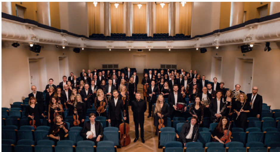
Eesti Riiklik Sümfooniaorkester