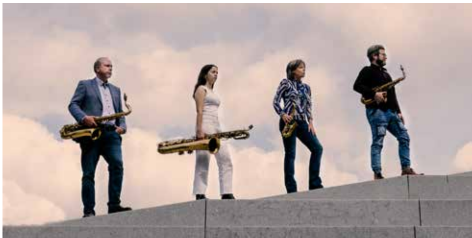
Raschèr Saxophone Quartet

„Kui virtuoosne puhkpillimäng oleks olümpia-ala, võidaks Raschèri kvartett kindlasti kuldmedali.“ (Die Welt)