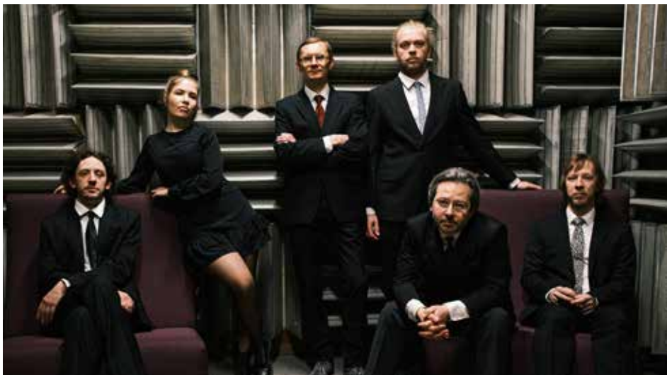
Eesti Elektroonilise Muusika Seltsi Ansambel

Organisatsiooni (UNPO) hümn (1997). Lisaks on ta Rahvaste Õiguste Instituudi juhatuse esimees, EKLi (1980) ja EHLi liige (1983) liige ning Eesti Akadeemilise Orientaalseltsi auliige.