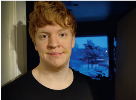
Martin Tuuling