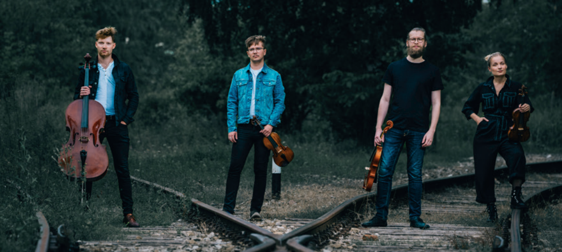
Keelpillikvartett M4GNET