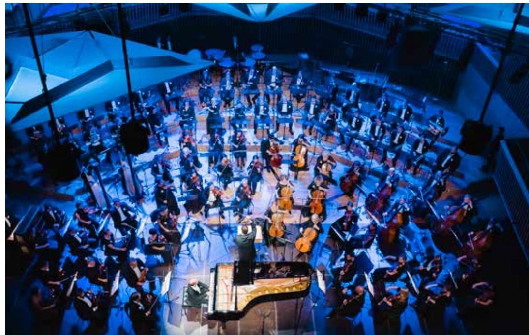
Läti Rahvusorkester