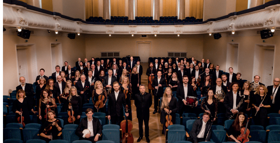
Eesti Riiklik Sümfooniaorkester